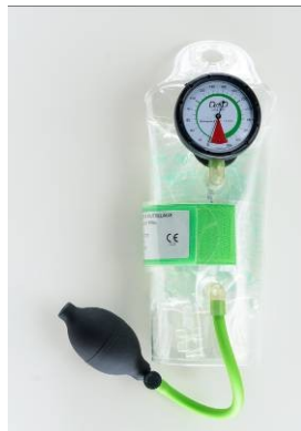
Visuel de face