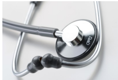
Visuel adulte et pédiatrique