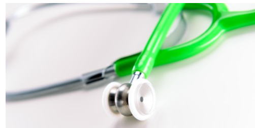
Visuel pédiatrique et adulte