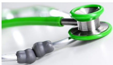
Visuel pédiatrique et adulte