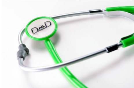
Visuel adulte et pédiatrique