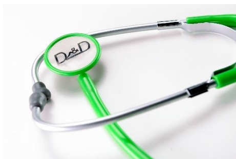
Visuel adulte et pédiatrique