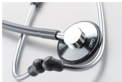
Visuel adulte et pédiatrique