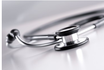
Visuel adulte et pédiatrique