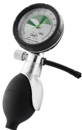
Visuel de face